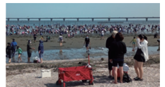
見立海岸潮干狩り場