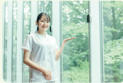
生活支援員・看護師をはじめとした 専門職員が利用者さまをサポートします

24時間・365日の体制で支援員が 常駐し、障がいをお持ちを方に幅広く ご対応します。万が一の体調不良時 にも看護師等がフォローし、利用者さま の生活をサポートします。