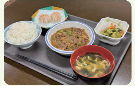
栄養面や塩分に配慮したお食事を 毎日ご提供いたします

障がい者グループホーム『オーシャンテラス』は、 「安全・安心・安楽」をモットーに知的障がい をお持ちの皆さまが笑顔で暮らせる「大きな家」を 目指しています。