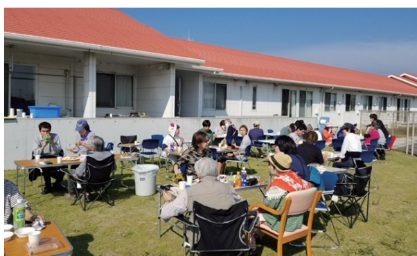
利用者さまと保護者さまによる バーベキュー会の様子