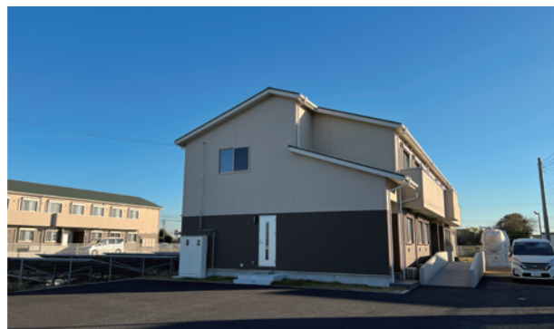
オーシャンテラスの2階建て棟 (バリアフリー対応済みです)